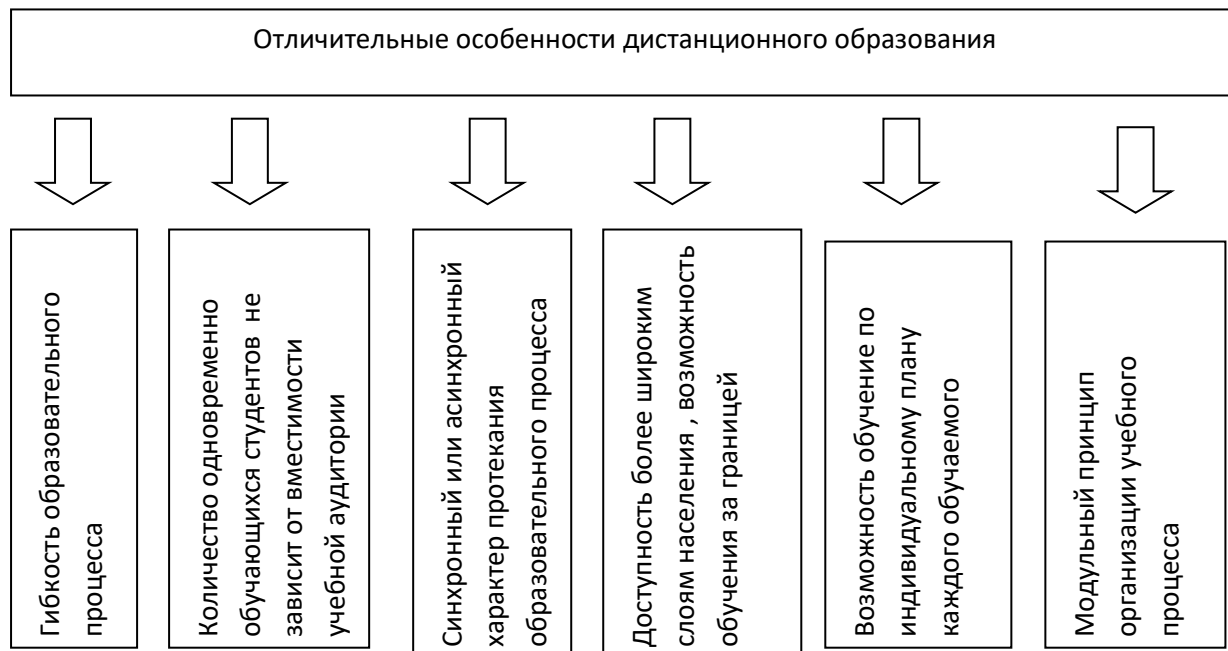
Figure 2. Отличительные особенности дистанционного образования

Авторы ***** выделяют следующие отличительные особенности дистанционного образования (Figure 2):