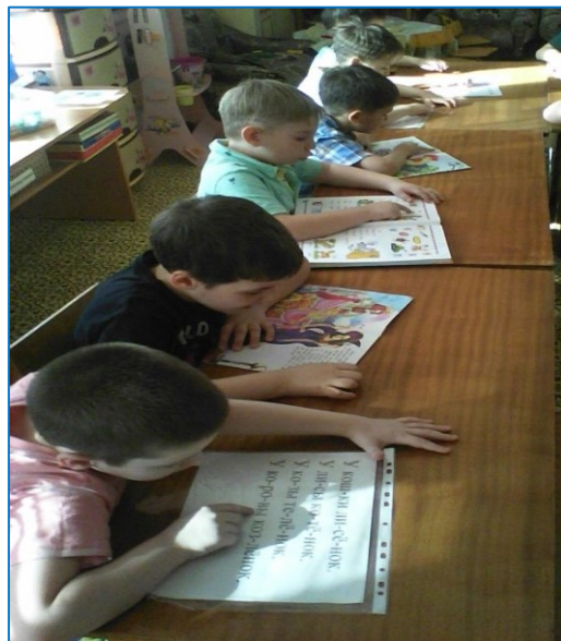
Фото № 3