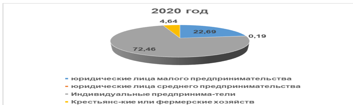
Рисунок 3 - Удельный вес активных субъектов МСП в 2020 году, %.

Примечание – составлено автором на основании источника [5]