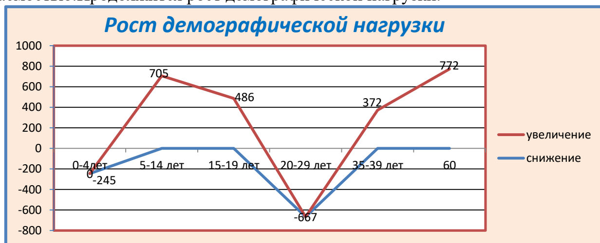
Диаграмма 1. Рост демографической нагрузки

По прогнозам ООН, к 2025 году население увеличится на 1,6 млн человек и составит 19,8 млн (в сравнении с 2018). Основной прирост будет обеспечен рождаемостью.Продолжится рост демографической нагрузки.